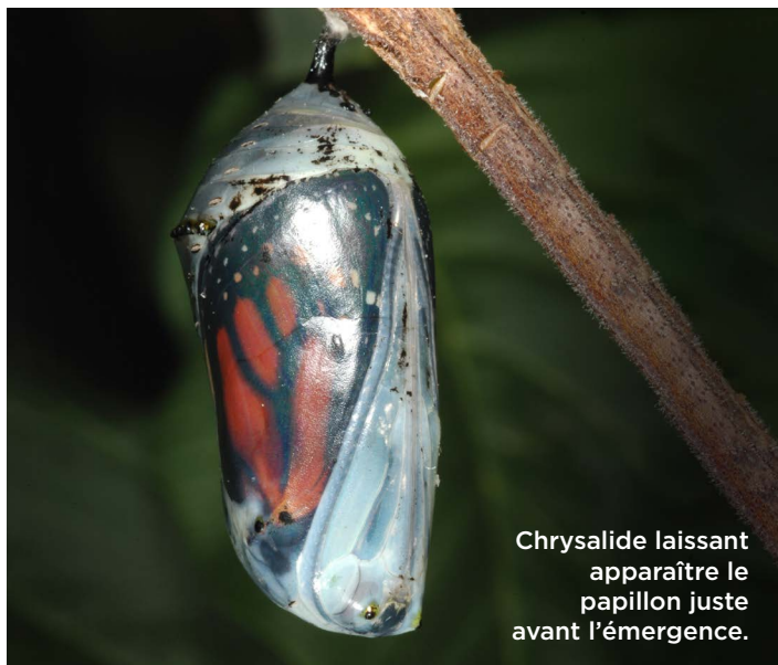
Chrysalide laissant apparaître le papillon juste avant l'émergence.