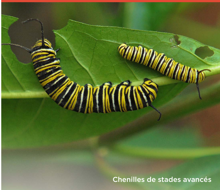
Chenilles de stades avancés