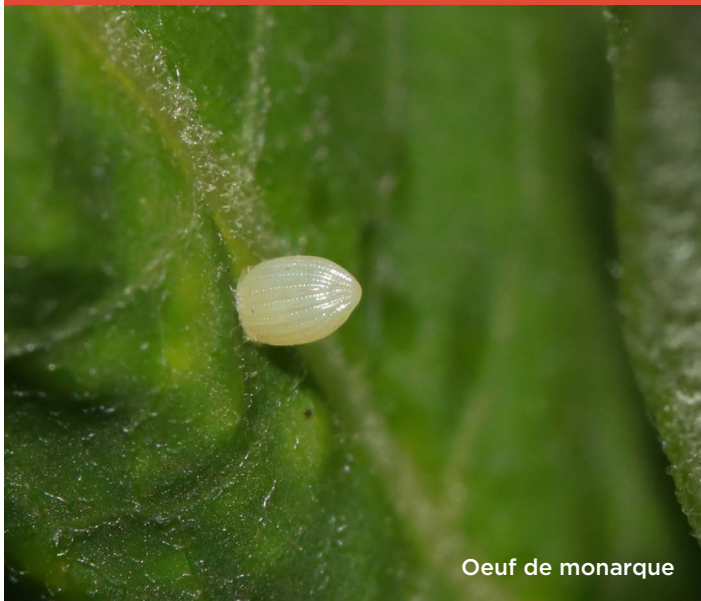
Oeuf de monarque