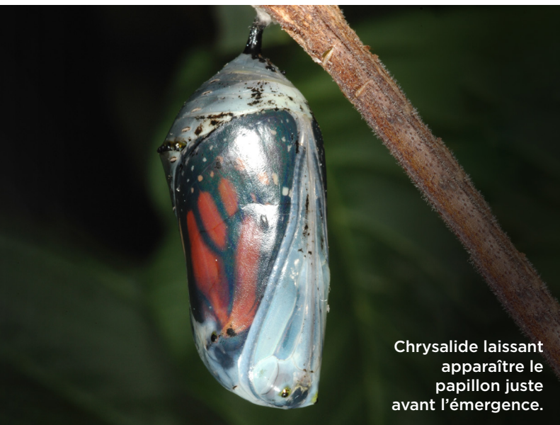
Chrysalide laissant apparaître le papillon juste avant l'émergence.